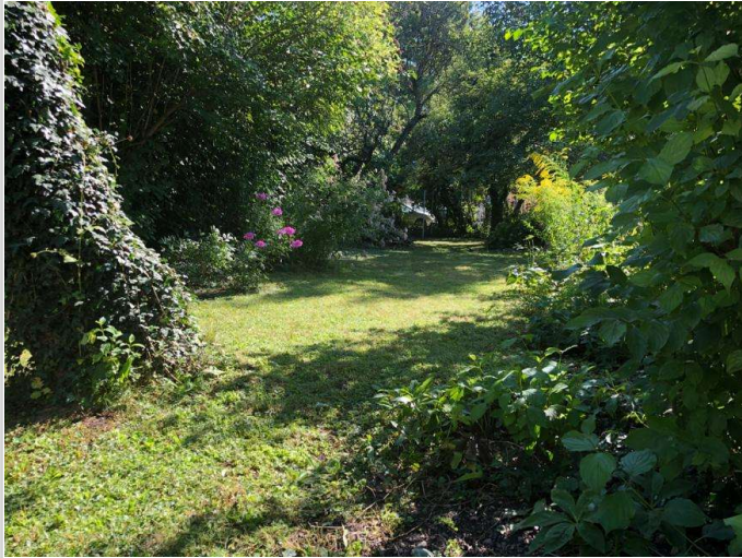
Karlsfeld Grundstck. Garten 5

Expose/Vermarktung/Besichtigung/Bonität/Kundenbetreuung - bis hin zum Notartermin - ab. Selbstverständlich auf Vertrauensbasis und natürlich für Sie als Eigentümer --- k o s t e n l o s ----